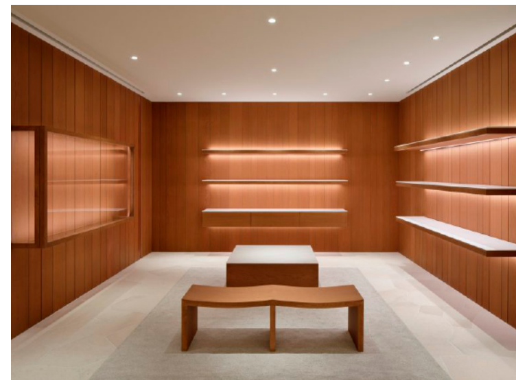
Tienda de lujo en Tokyo . Diseñador: John Pawson.

Empresas asociadas en AEIM ✓ PROFESIONALIDAD Y COMPROMISO AMBIENTAL