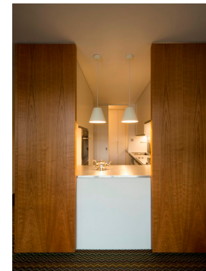
Vivienda en Londres. Azman Architects.