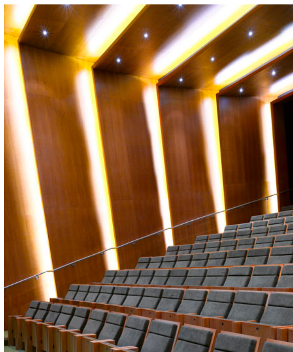
Centro de Artes visuales. Colchester. Arquitecto Rafael Viñoly.